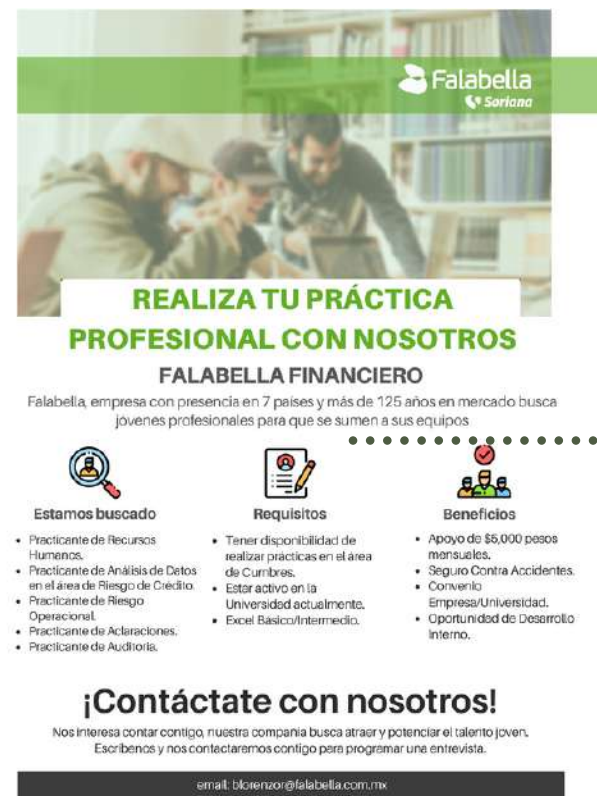
Afiche para difusión de vacantes de practicantes

Realización de material gráfico para potenciar la inscripción a cursos o a iniciativas que se realizan en la empresa. Esto como apoyo al área de capacitación, reclutamiento y evaluación de desempeño.